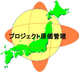
プロジェクト原価管理

インターネット／イントラネットに対応した統合業務管理 Webソリューションパッケージ「ソフトウェア業向け」です。